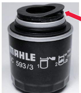
Рисунок 2: Верхняя прокладка (приподнята для лучшей наглядности) служит для перекрывания механики слива масла во фланце.