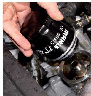
Рисунок 3: При демонтаже старого фильтра необходимо следить за тем, чтобы моторное масло не попадало на ременный привод или внутрь генератора.